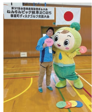
試合が行われた御嵩町のキャラクター・ミーモクんと記念撮影。

ディスクゴルフは、当面ねんりんピックに採用されていませんが、機会があれば、また滋賀県代表として参加できるように、日々技を磨きながら健康的に暮らしていきたいと思っています。