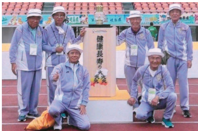
待ちに待った感動の開会式を終えて。(前列左端)