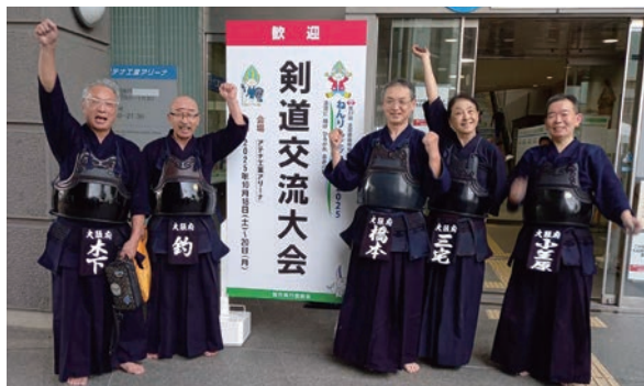
チーム一丸となって全力を尽くした 大阪府のチームメイトとともに。(左端)

しかし、3日間、本当に楽しい時間を過ごさせていただき感謝しかありません。今回お世話になった関係者の皆様、審判員、一緒に戦った大阪府チームメイト、また、お互いに応援合った大阪市、堺市チームの選手の方々、対戦相手のチームの方々、本当にありがとうございました。剣道の心、交剣知愛の気持ちを込めて感謝の意を表します。