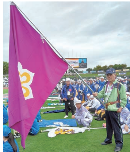
総合開会式では京都府選手団の旗手を務め、貴重な思い出に。