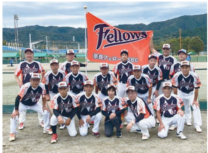
ベスト4に残り喜びに沸く奈良フェローズ SBC。(後列左から2人目)