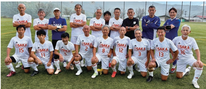
声を掛け合い全員で金メダルを勝ち取った大阪市選抜チーム。(後列右端)