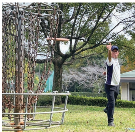
練習にも気合が入る。

ディスクゴルフとは、フライングディスク(俗にいうfrisbee)を投げてゴールに入れるまでの回数の少なさを競うゴルフと同じような競技です。適度な運動性があり、競技性や奥の深さも備えているため、飽きずに末永く楽しめるスポーツです。なかなか目に触れるチャンスがないため知らない人が多いのですが、今回のねんりんピック