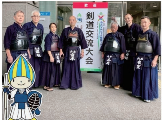
剣道大会の会場にて兵庫県チームで記念写真。(左から3番目)