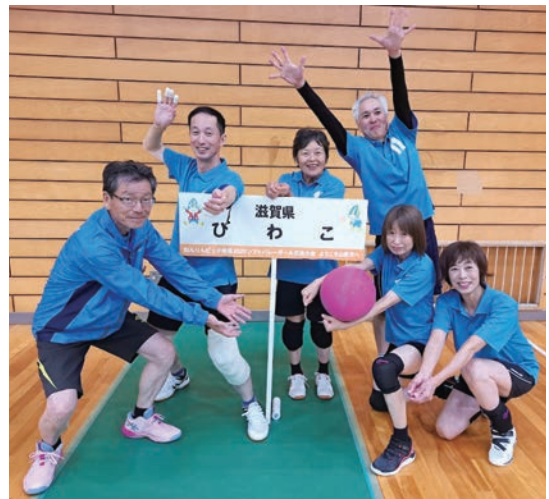
試合前はチーム全員リラックスの表情。(本人左端、妻右端)

ぎふ大会開催に携わったすべての皆様に感謝し、ねんりんピックが私たちの目標としていつまでも続くことを願います。次はどんなドラマが待っているか楽しみです。