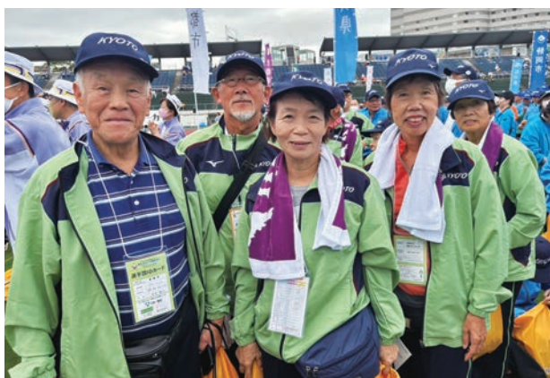
総合開会式でチームメイトと一緒に記念撮影。(左から2番目)

大会中は競技だけでなく、夜の交流親睦会も楽しく、有意義な(?)情報交換ができたことは貴重な経験になりました。この年になって初めての新しい体験ができるのはうれしいことです。できれば今後も、何かの種目で参加できたらと思っています。ねりんピックはスポーツだけでなく、囲碁、俳句、健康マージャン、将棋、かるたなど文化交流大会も行われます。皆さんもぜひ、ご自分のできる種目で参加されてみてはいかがでしょうか。