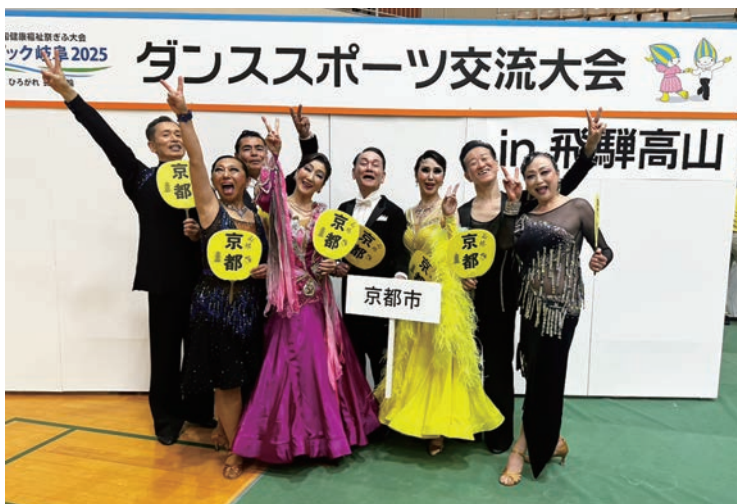
これから団体戦。頑張るぞ！（右から2番目）

競技に真剣に取り組み、結果を残し、そして仲間と心底楽しむことができた、本当に楽しみまくった最高の3日間でした。今回のねりんピックで得られた「喜びを分かち合う絆」と「最高の健康状態」は、私たちがこれからも地域やダンスライフで輝き続けるための活力となります。