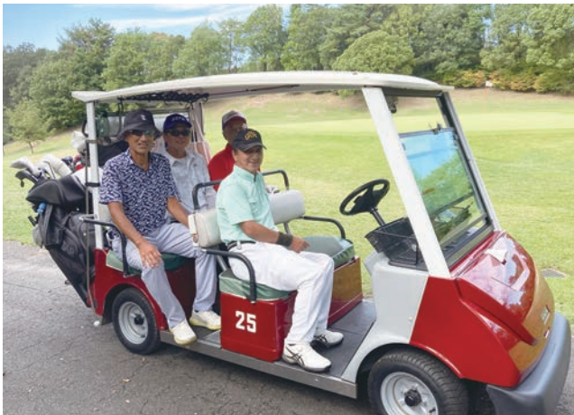
さあ、頑張るぞー! (後列左端)

今後はもう少しまくなって、東京大会でリベンジを誓う今日この頃です。ゴルフ場の営業の関係もあると思いますが、せっかくのねりんピックですので、ゴルフの選手も開会式に参加しやすいよう日曜日に試合を開催していただけたらと願っています。なお、写真は生真面目な県事務局の担当が、大会係員さんに注意されながら撮ってくれたもので、ゴルフ大会関係者の皆さんにはこの場をお借りして、担当者で代わりお詫び申し上げます。