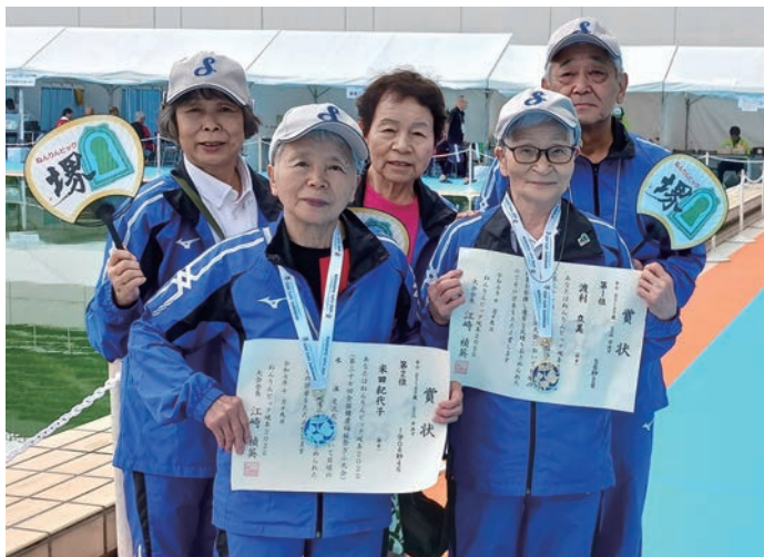
優勝の賞状を胸に、堺市選手団のメンバーと。(前列右端)

水泳は私の人生において生きがいの一つで、楽しい時間です。これからもまだまだ続けて、健康を維持したいと思います。