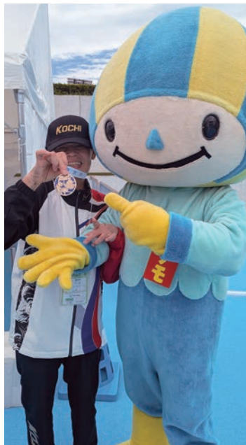
大会キャラクターのミナモちゃんと 金メダルを手に記念撮影。

山を愛し、水を愛し、人を愛してここまで来られたこと。そして支えてくれた仲間と、温かく応援してくださる多くの方々に、心から感謝しています。都築先生、見ちゆうかえ—私はやったでえ。