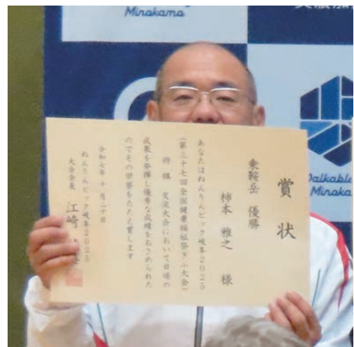
個人戦の金メダルの賞状を笑顔で受け取った。

翌日は予選落ちしたので個人戦にまわる。全国的な強豪は皆、団体戦の決勝トーナメントのほうに行っていたので、割と楽に4連勝し、金メダルを獲得した。大会の合間には、20年振りに会う人や懐かしい人たちとの交流があり、貴重な時間が過ごせた。ホテルは夕食なしとしていたので毎晩、飛騨牛などの名産品を食べ歩いた。コロナ禍以降、他県に行くことがほとんどなかったので、4泊5日の岐阜の旅は久しぶりに刺激があり楽しむことができた。