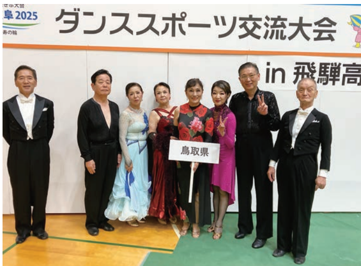
笑顔があふれる鳥取県ダンススポーツチーム。 (右から2番目)

最後に岐阜県民の皆さん、ボランティア、そしてご協賛いただいた皆様に心から感謝申し上げます。ありがとうございました。とても楽しい大会でした。