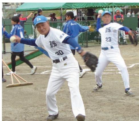
試合前にキャッチボールで肩慣らし。(左)

また、この大会に出場したいと思っています。関係者の皆さん、よろしくお願ひします。