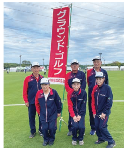
全力でプレイした競技会場にて。(後列左端)