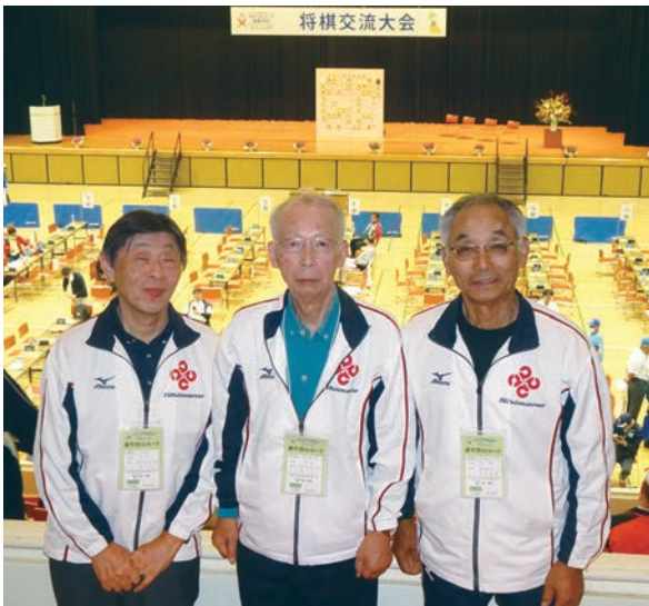
団体戦でともに戦った出雲のイナズマチーム。(左端)

これからも将棋教室の継続を社会貢献の一つとして、生きがいを持って取り組んでいきたいと思っています。