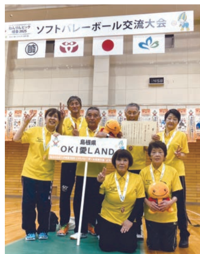
表彰式の後、銅メダルを首にかけてチームメイトと。（左端）

最後に、大会を支えてくださったボランティアの皆さん、そして応援に来てくださった島根県社会福祉協議会の皆さんに、心から感謝申し上げます。ありがとうございました。