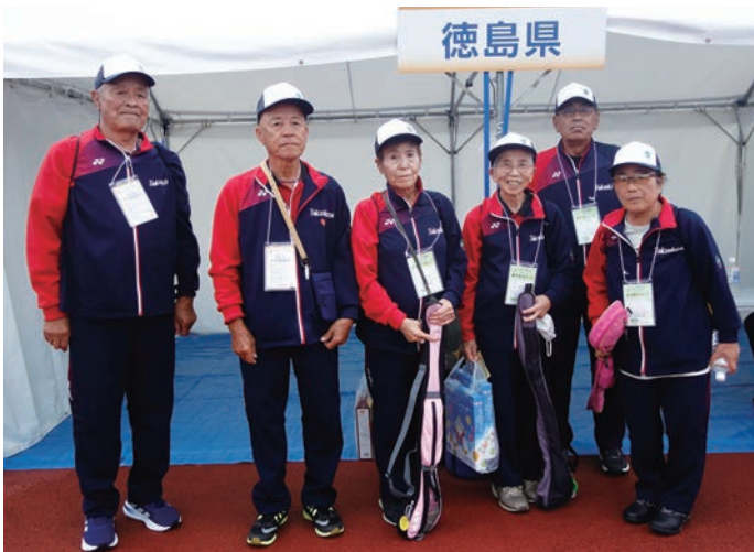
総合開会式の終了後、選手全員で健闘を誓い合う。(左から2番目)

お世話してくださったとくしま“あい”ランド推進協議会の皆様をはじめ、大会関係者の皆様、本当にありがとうございました。