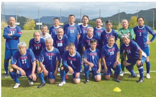
最後まで走り抜いた選手たちに拍手！ (後列右から6番目)