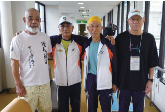
大健闘した山口県チームの4人。(右端)

最後に、今大会の準備から実施、運営に関わった関係者の皆様に感謝を申し上げたいと思います。本当にありがとうございました。