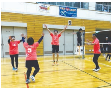
決まった！勝った！バンザイ！（左端）

島根県予選は、行きたい気持ちが強い分、緊張しました。全試合がフルセットという過酷な戦いになりましたが、なんとか優勝し、ぎふ大会に参加できることになりました。コロナも5類感染症へ移行し、選手団全員が参加できる総合開会式は本当に素晴らしいものでした。天気も最後までなんとかもち、自由参加の郡上踊りでは、地元ボランティアの学生さんと一体感を味わい、最高の時間になりました。