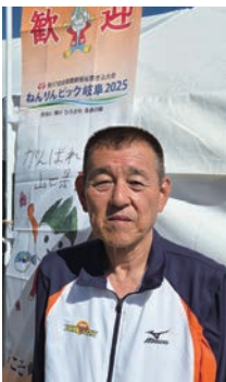
山口県選手団を代表し、旗手として参加。

これまで多くのことを続けてこられたのも、家族の協力があったからこそで、とても感謝しています。これからも体力が続く限り、頑張っていきたいと思います。