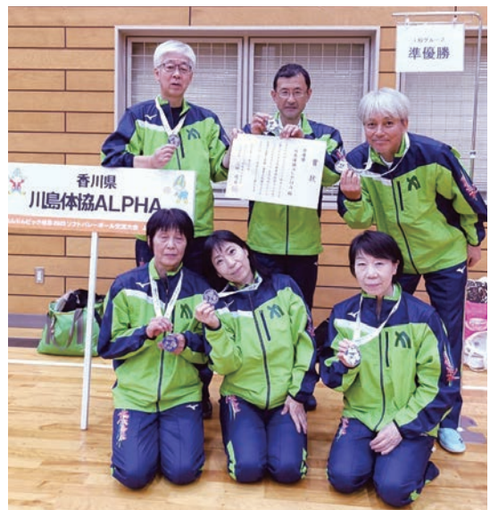
表彰式後にチーム全員で記念写真。(後列左端)

最後になりましたが、このような大会を開催していただき、関係者の皆様のご尽力に心より感謝を申し上げます。あわせて、チームの皆様、全国のソフトバレーボール愛好者の皆様にも、深く御礼を申し上げます。では、またいつの日か、どこかで元気にお会いしましょう。