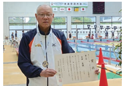
25m、50mバタフライで念願の優勝。