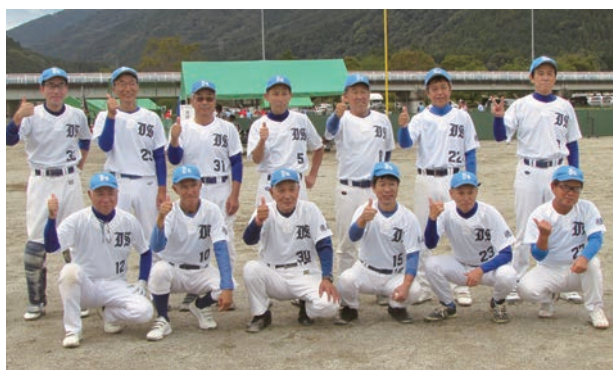
目標だった1勝を達成し、笑顔で記念撮影。(前列左から3番目)