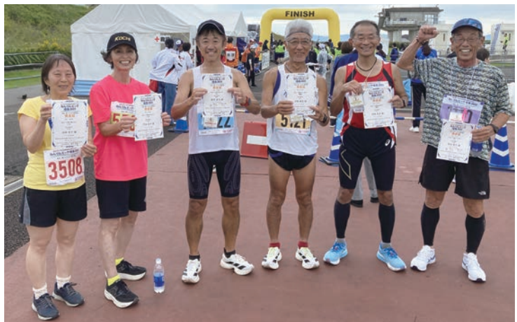
笑顔のゴールを約束し合った高知県チーム。(右から2番目)