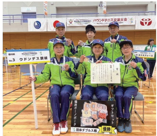
2連覇を達成し、歓喜の表彰式を終えて。(前列中央)