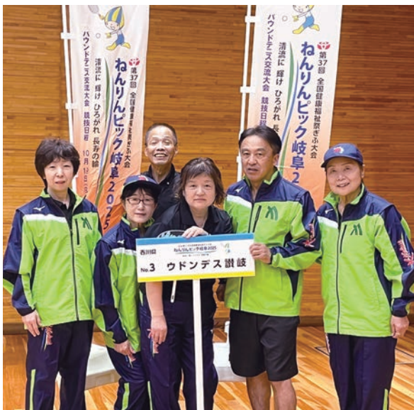
チームカードを持って記念撮影。(右から3番目)